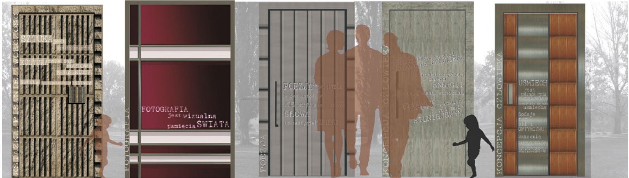
6 tworzywo sztuczne Podróż do Afryka