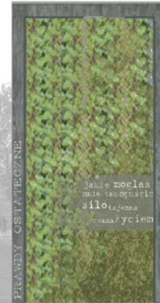
15 pnącza na stełażu z siatki Symboliczne przejście prowadzące do zbiorów Kapuścińskiego w Bibliotece Narodowej