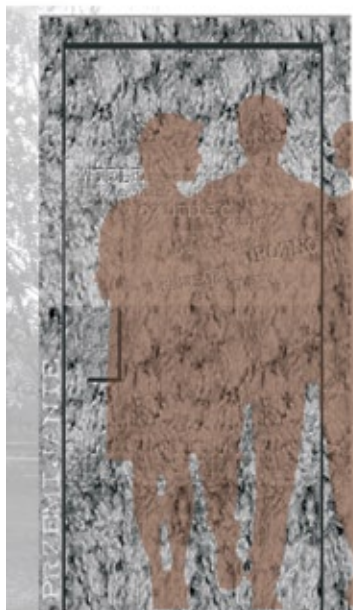
11 tworzywo sztuczne Istota jednostki