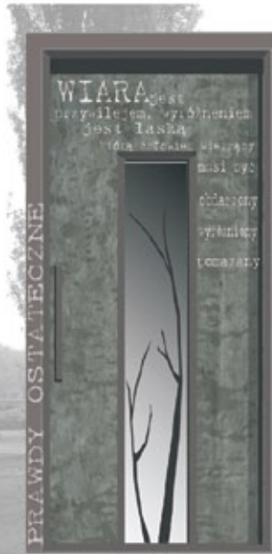
14 stal Życiorys