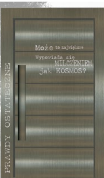
13 stal Reportaż