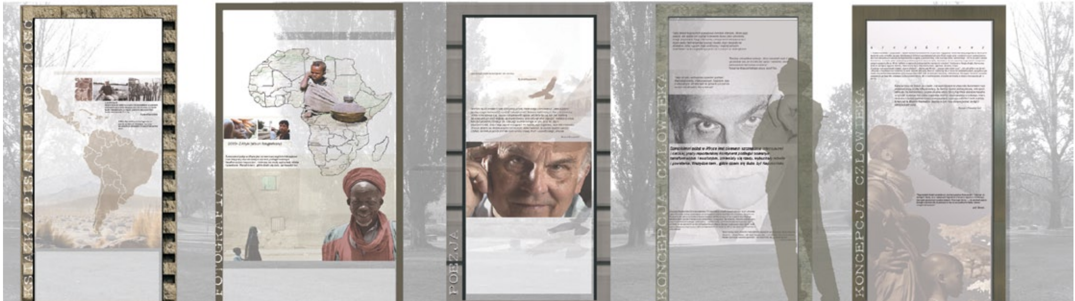
10 stal i drewno Podróż