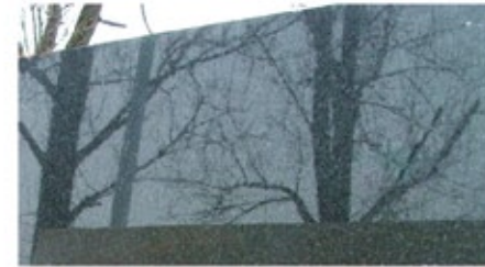
Granit Angola Blue