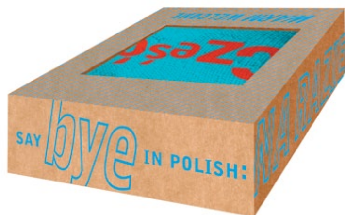
■ OPAKOWANIE wym: 7x12x5 cm, pudełko z surowców wtórnych w kolorze naturalnym