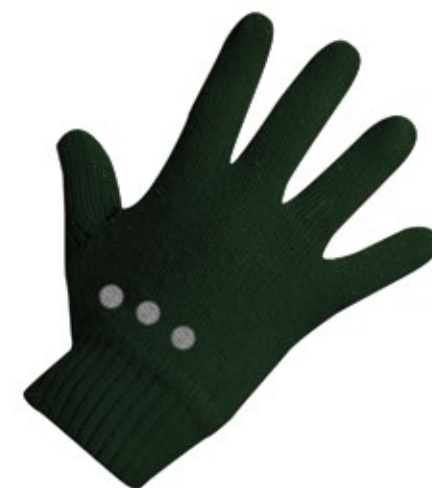
■ rękawiczki PRAWA I LEWA, GRZBIET dłoni