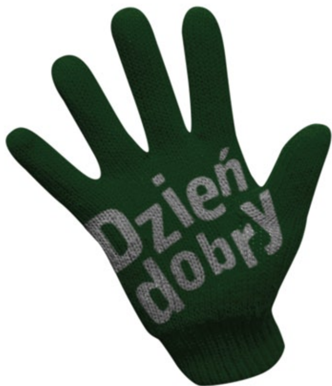
■ rękawiczki PRAWA I LEWA, część WEWNĘTRZNA dłoni