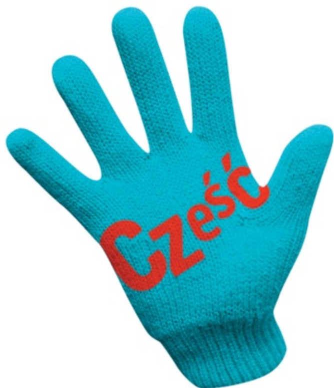
■ rękawiczki PRAWA I LEWA, część WEWNĘTRZNA dłoni