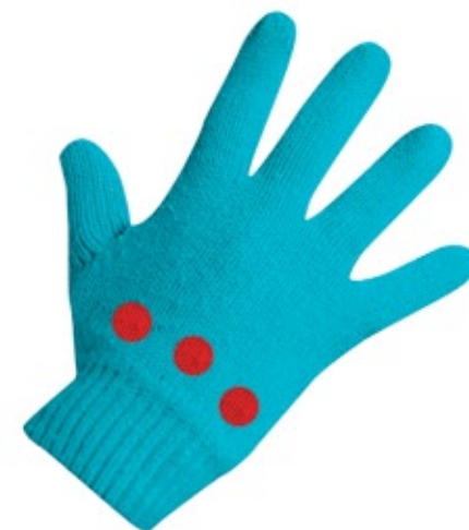
■ rękawiczki PRAWA I LEWA, GRZBIET dłoni