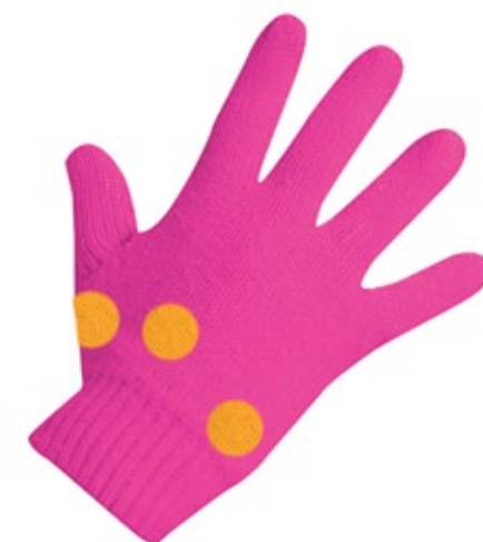
■ rękawiczki PRAWA I LEWA, GRZBIET dłoni