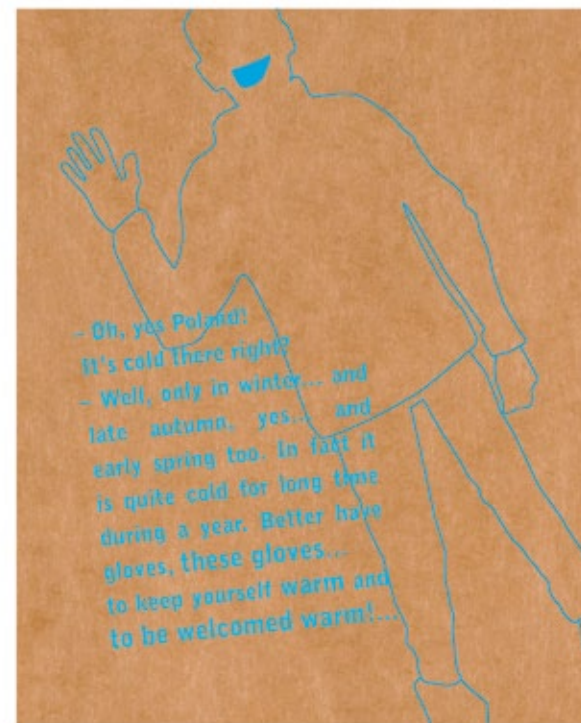
■ SPÓD OPAKOWANIA wym: 7x12 cm /widok w powiększeniu/