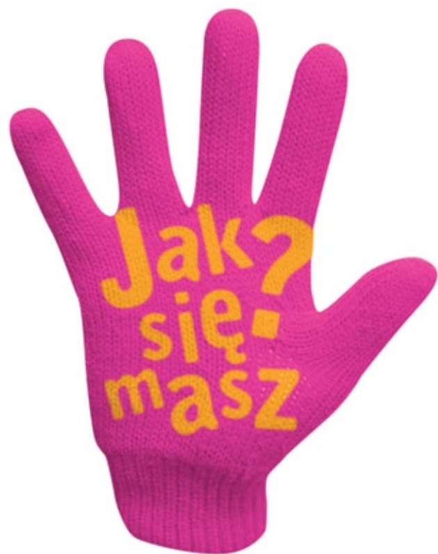
■ rękawiczki PRAWA I LEWA, część WEWNĘTRZNA dłoni